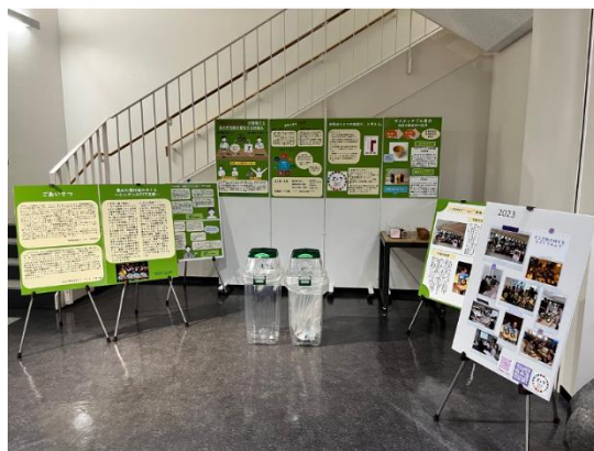
⑰ ゼミ活動展示会の展示風景