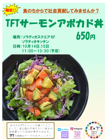
⑯ 青舎祭提供「サーモンアボカド丼」