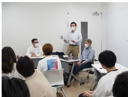
⑱ アサヒグループジャパンとの SDGs 活動に関する意見交換会