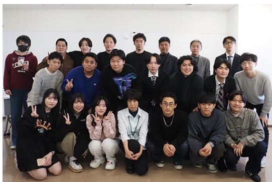
⑪ ワークショップ後の集合写真 (アサヒ本社マーケティング部の方々と)