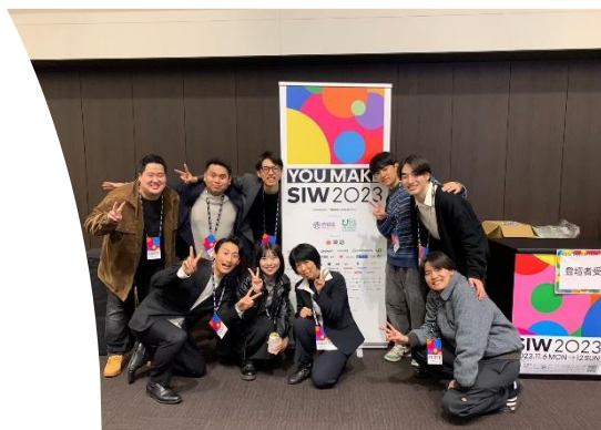
⑭ 都市フェス siw2023 交流会